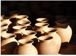
Luang Prabang 📍