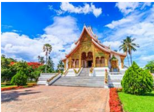
Luang Prabang 📍