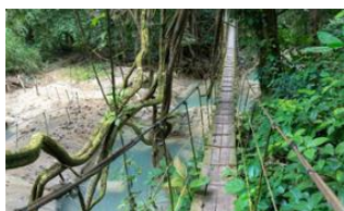
Luang Prabang 📍

d'aventure au son des cascades sur fond de superbes vues dominant la vallée de Luang Prabang !