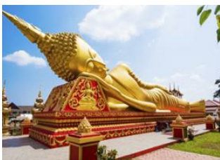
Vang Vieng 📍 🚗 - ⌚ 3h Vientiane 📍