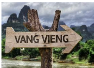
Luang Prabang 📍