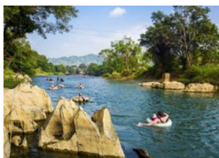
Vang Vieng 📍