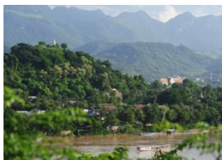
Luang Prabang 📍