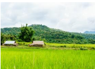
Xieng Khouang 📍