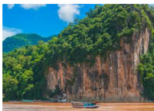
Village de Hmong 📍