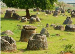
Luang Prabang 📍 🚗 - ⌚ 6h Xieng Khouang 📍