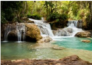
Luang Prabang 📍 🚗 32km - ⌚ 30m Chutes de Kuang Si 📍 🚗 32km - ⌚ 30m Luang Prabang 📍