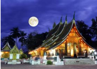
Luang Prabang 📍