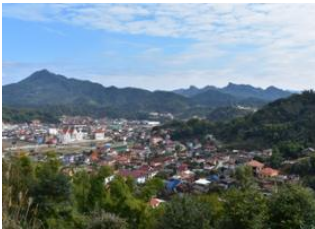
Xieng Khouang 📍