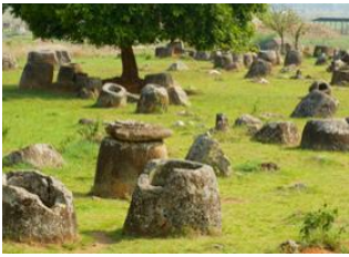
Xieng Khouang 📍