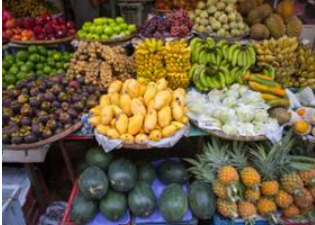
Luang Prabang 📍