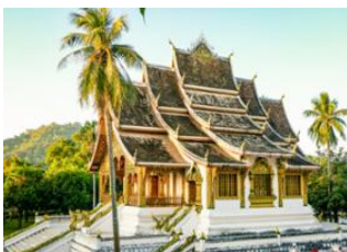
Luang Prabang 📍