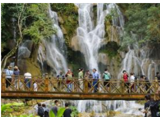
Luang Prabang 📍