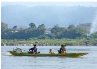
Luang Prabang 📍