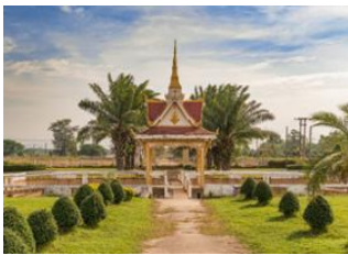
Konglor 📍 - 🕒 5h Thakhek 📍