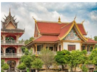
Thakhek 📍 🚗 - 🕒 3h Savannakhet 📍