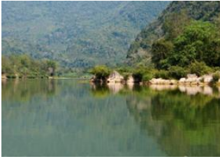
Muang Khua 📍 🚣 - ⌚ 4h Muang Ngoi 📍