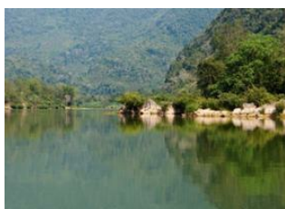
Muang Khua 📍 🕒 - ⌚ 4h Muang Ngoi 📍