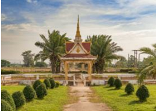
Konglor 📍 - ⌚ 5h Thakhek 📍