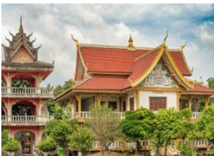
Thakhek 📍 🚗 - ⌚ 3h Savannakhet 📍